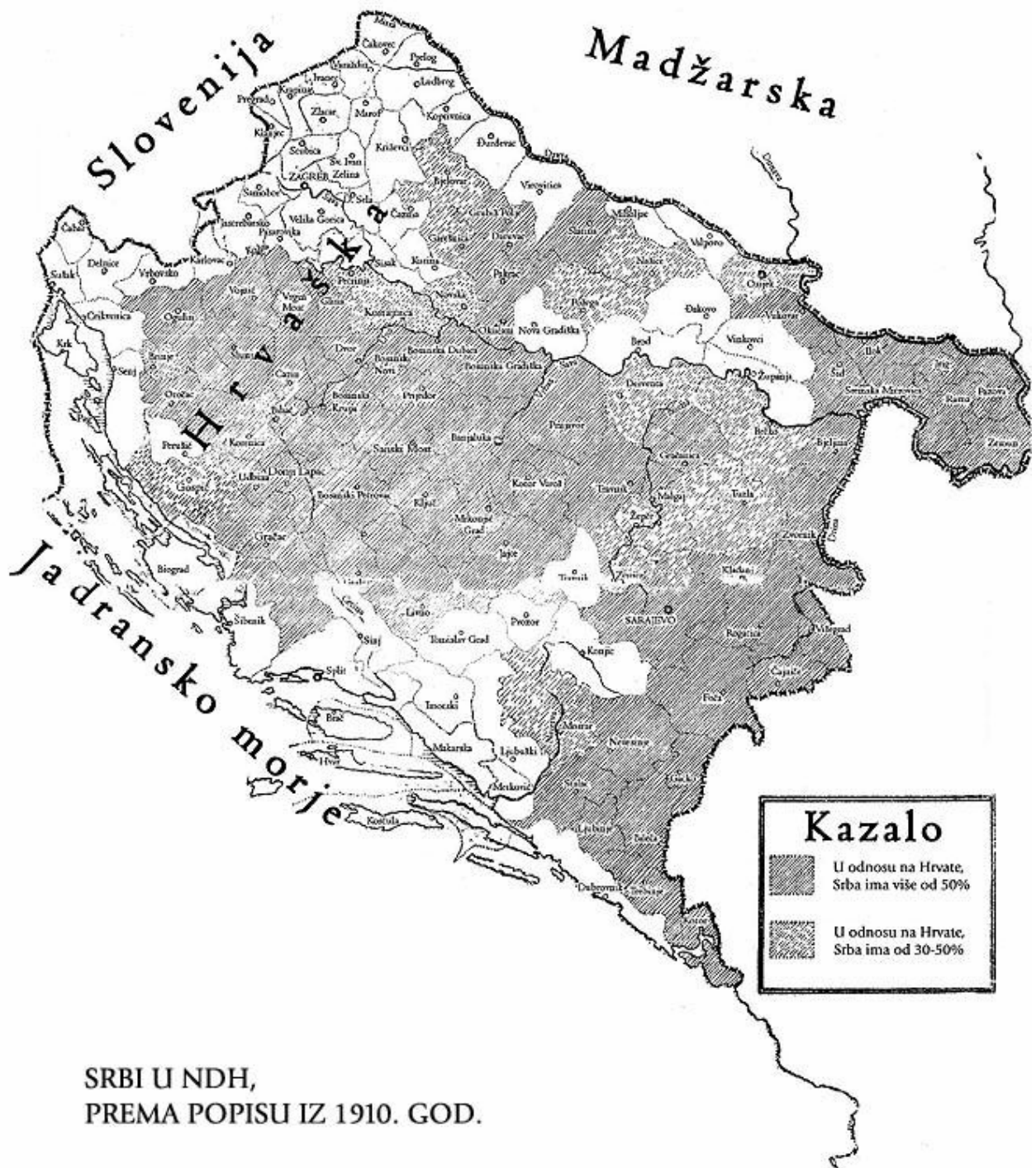
SRBI U NDH, PREMA POPISU IZ 1910. GOD.