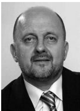
Zmago Jelinčič Plemeniti